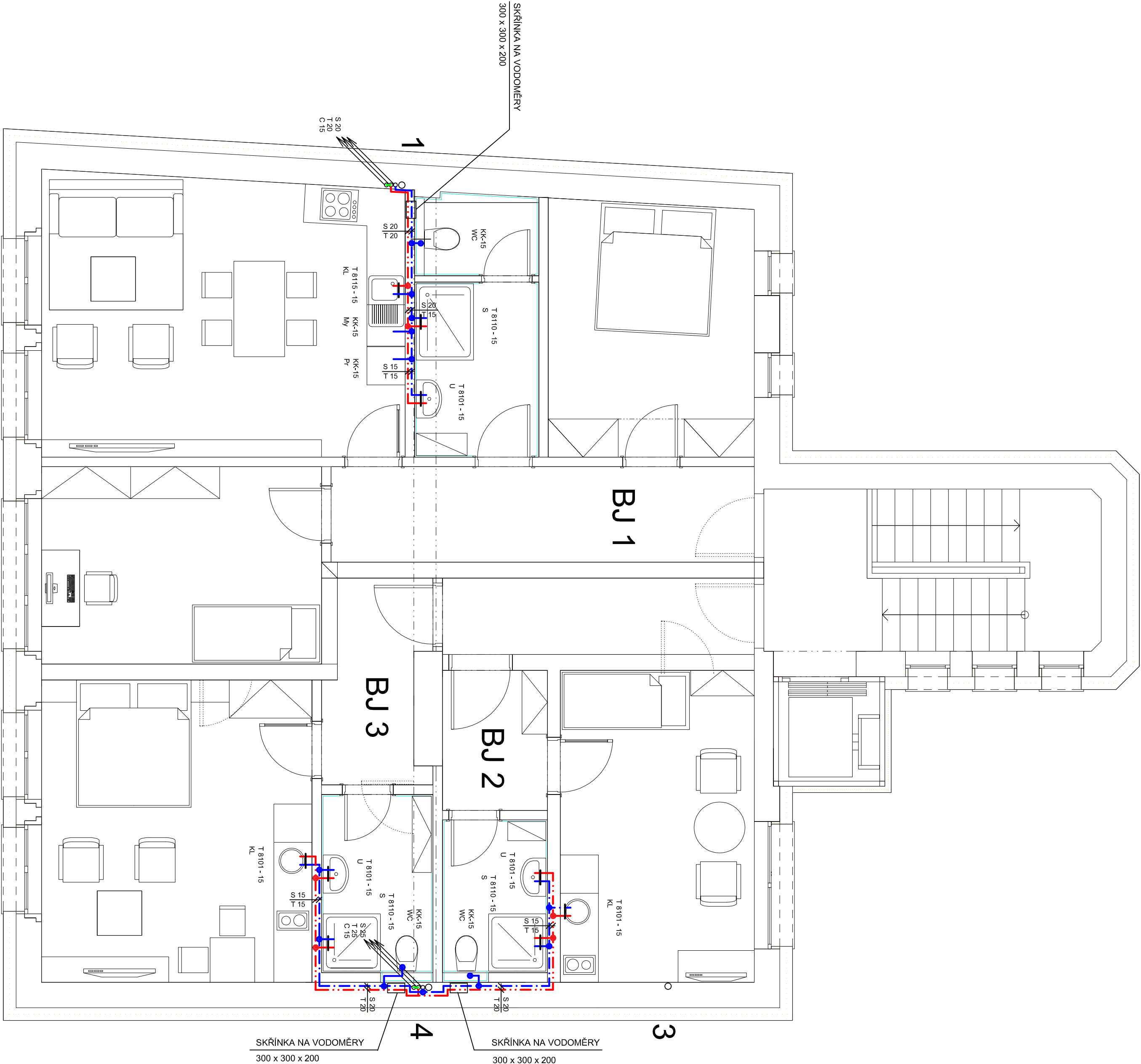
SCHEMA ZAPOJENÍ ODOBOČKY DO BYTU Č. 1 SCHEMA ZAPOJENÍ ODOBOČKY DO BYTU Č. 2 A 3